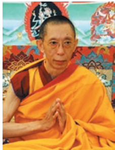
Venerable Geshe Kelsang Gyatso