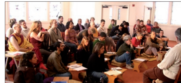
Diskussionsstunde am KMC Washington, USA

“Manchmal kommt es einem vor, als ob der Dharma dort und wir hier wären. Es fällt uns schwer, den Dharma in unseren Alltag zu integrieren und so können wir ihn nicht nutzen, um unsere Probleme zu lösen.