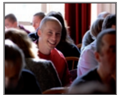
Szenen von Internationalen Festivals der NKT-IKBU