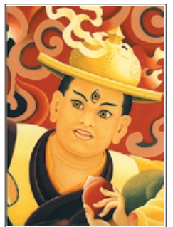
Der Dharma-Beschützer Dorje Shugden, eine Manifestation des Weisheits-Buddhas

Einige Menschen behaupten, dass der fünfte Dalai Lama und ein Gelugpa-Lama namens Ngawang Chogden die Shugden-Praxis ablehnten, aber dies ist falsch. Es gibt keinen Beweis für diese Behauptung und es gibt keinen einzigen gültigen Grund zu sagen, dass Dorje Shugden-Praktizierende eine Sekte sind.