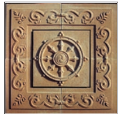
Hilf anderen durch das Drehen des Dharma-Rades

Gemäß des NKT-IKBU-Adressverzeichnisses von Zentren und Gruppen des Kadampa-Buddhismus von 2007 gibt es weltweit etwa 1100 NKT-Haupt-Dharmazentren und -zweigstellen. In Deutschland, Österreich und der Schweiz gibt es gegenwärtig 22 Dharmazentren, die alle eingetragene gemeinnützige Vereine sind, und etwa 55 Zweigstellen dieser Zentren. Alle NKT-Zentren sind im NKT-IKBU-Adressverzeichnis aufgelistet, das jährlich aktualisiert wird. Eine Datenbank von Zentren wird auch auf der NKT-IKBU-Webseite geführt.