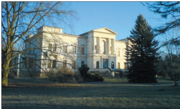
Kadampa Meditations- zentrum Deutschland

In der Vergangenheit lehrte ein Zentrumslehrer der NKT seinen Schülern in einer Unterrichtsstunde des Studienprogramms, „Ihr solltet keine anderen Bücher außer denen Geshe Kelsangs lesen“. Die Motivation dieses Lehrers war, den Schülern zu helfen ihre Examen zu bestehen, indem sie Ablenkungen oder Verwirrung verhindern, die aus dem Lesen anderer Bücher entstehen könnten. Aber dies ist keine NKT-Regel – NKT-Leute haben natürlich die Wahl, welche Bücher sie lesen. Der Ratschlag dieses Lehrers entstand nicht aus einer sektiererischen Einstellung heraus – er versuchte lediglich den Schülern zu helfen, ihre Examen zu bestehen.