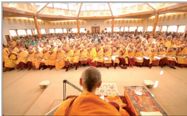
Der Tempel bei Internationalen Festivals der NKT-IKBU am Manjushri KMC, England