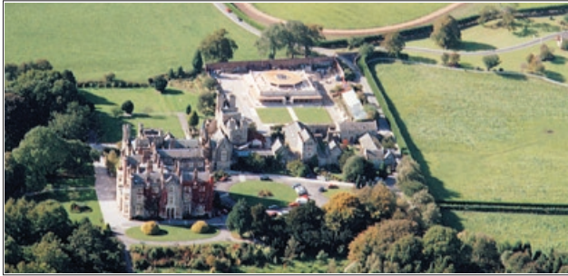
Manjushri Kadampa Meditation Centre, England

wahren. Bricht eine ordinierte Person in der NKT-IKBU ihre Gelübde, dann muss sie ihr Dharma-Zentrum und Studienprogramm für mindestens ein Jahr verlassen. Anschließend kann sie zurückkehren, kann jedoch kein NKT-Dharmalehrer mehr werden. Diese Regel wurde nur aufgestellt, um die Reinheit des heiligen Dharmas zu beschützen, um dem zukünftigen Bruch der Ordination vorzubeugen und um das Vertrauen der Menschen zu beschützen.